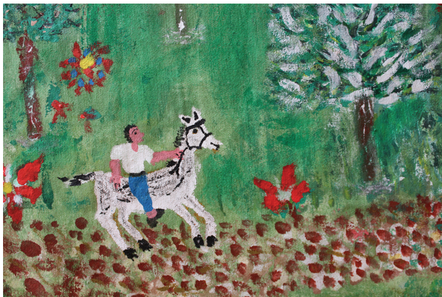
Ε. Παπαναστάση Λεπτομέρεια Λαδομπογιά σε ύφασμα 2 μ. x 1 μ.

σχετικές με τό μονοπάτι πού θά ακολουθοῦσα γιά νά φθάσω στήν κορυφή. Μοῦ ὑπέδειξε δύο μονοπάτια, τό ἕνα κάπως ὀμαλότερο ἀλλά μακρύτερο, τό δεύτερο κοντινότερο ἀλλά πολύ ἀνηφορικό καί μοῦ συνέστησε νά προσέχω.