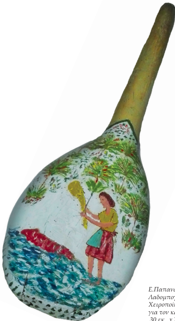
Ε.Παπαναστάση Λαδομπογιά σε ξύλο Χειροποίητο αντικείμενο για τον καθαρισμό υφαντών 30 εκ.. x 70 εκ.

Ὡς τώρα παραμένει ἀγνωστο τί περιεῖχε αὐτό τό καζάνι, θυσσαυρό ἢ σκουριασμένα καρφωπέταλα.