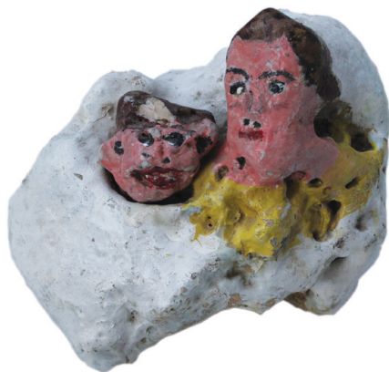
Ε.Παπαναστάση Λαδομοργιά σε πέτρα 15 εκ. x 10 εκ.