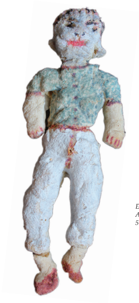
Ε.Παπαναστάση Ακρυλικά σε αλατοζύμαρο 5 εκ. x 20 εκ.