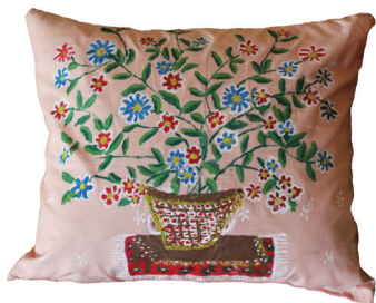
Ε.Παπαναστάση Λαδομπογιά σε ύφασμα 40 εκ. x 40 εκ.

“ Όποιος δέν ἔφκιασε χαλᾶ καὶ ὅποιος ἔφ- κιασε δέν χαλᾶ ” Δ. Παπαντωνόπουλος Ἀκαρνάν