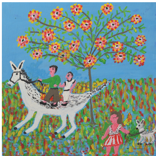
Ε.Παπαναστάση Ακρυλικά σε καμβά 40 εκ. x 40 εκ.

Θυμᾶμαι τίς ραχοῦλες, τίς πλαγιές, τά ρέματα, τίς σπηλιές καί τούς γκρεμούς, πάνω στούς ὁποίους σκαρφαλώναμε γιά νά φθάσουμε τά κωσταντίνια, πού μαζί μέ τ’ἄλλα τά μυριόχρωμα καί μυρωμένα ἀγριολούλουδα, ἀηβαίβαρο, βιολέτες, ἀνθισμένη ἀλιφασκιά καί τόσα ἄλλα, θά στολίζανε τή Μεγάλη Παρασκευή τόν Ἐπιτάφιο.