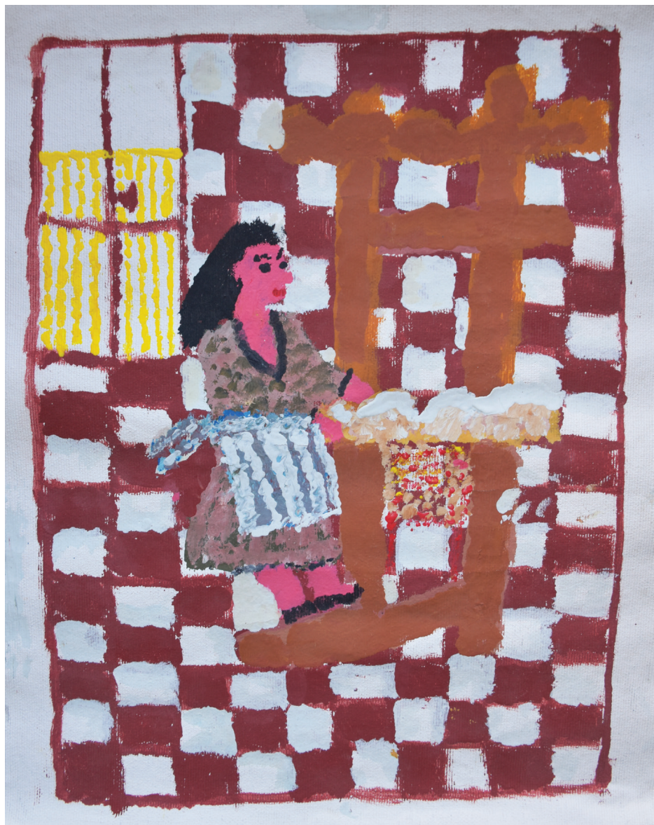
Ε. Παπαναστάση Ακρυλικά σε καμβά 40 εκ. x 30 εκ.