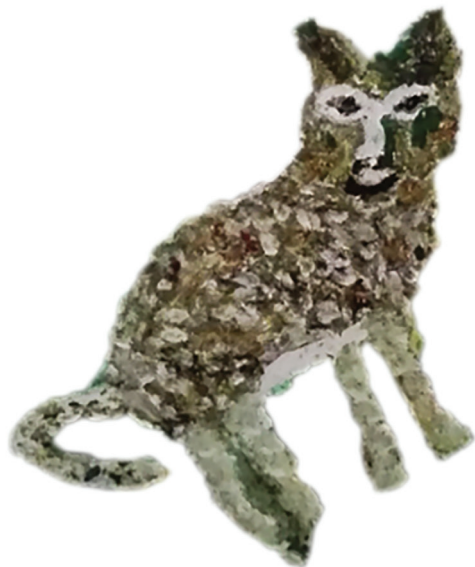
Ε.Παπαναστάση Λεπτομέρεια Λαδομπογιά σε γυαλί 10 εκ. x 8 εκ.