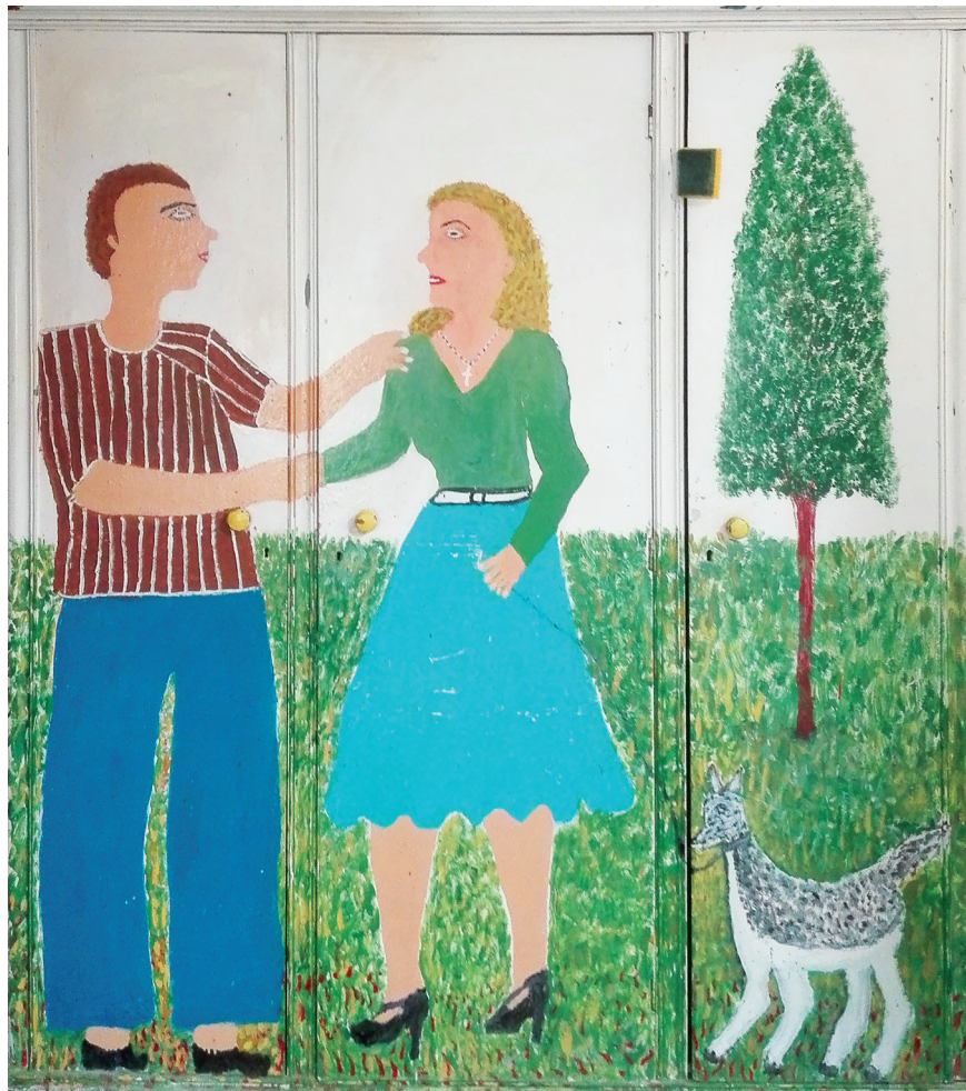
Ε.Παπαναστάση Λεπτομέρεια, Λαδομπογιά σε ξύλο Ντουλάπα της ανλής της οικίας, 1,50 μ. x 2,20 μ.