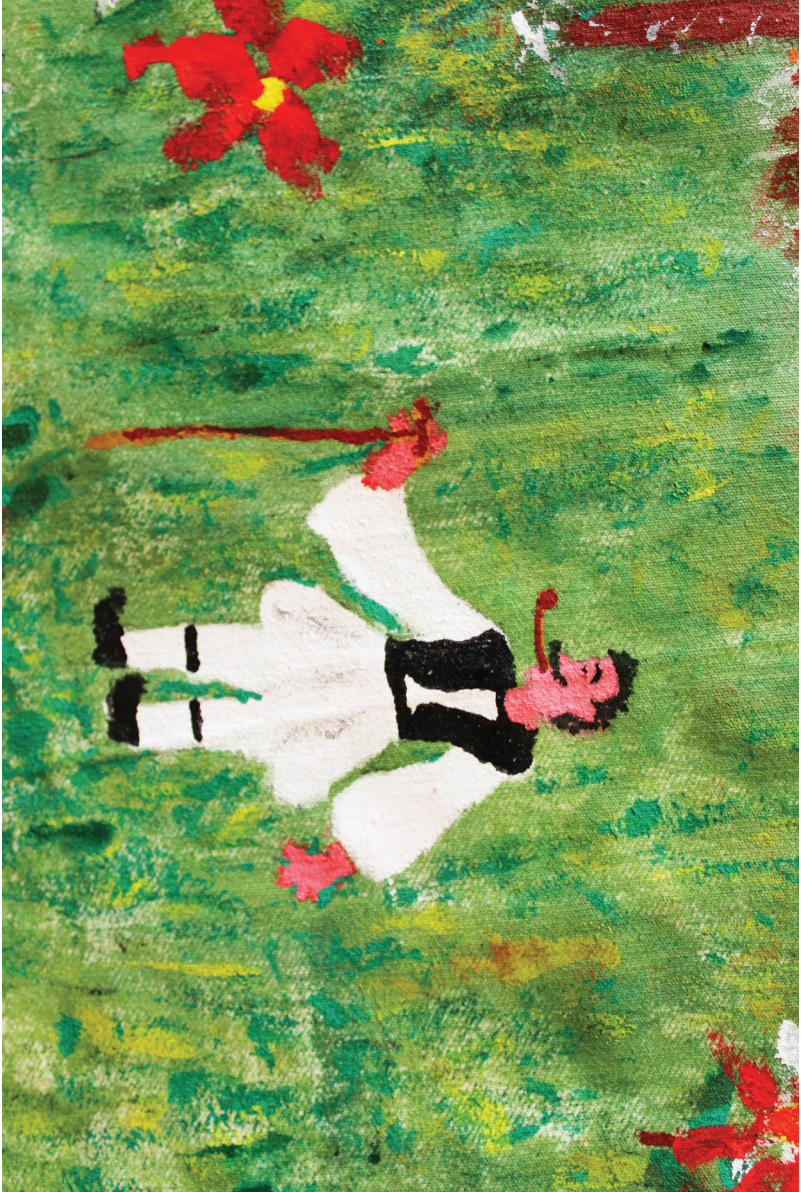
Ε. Πανααστάση Λεπτομέρεια, Λαδομηντογιά σε θάσσημα, 2 μ. x 1 μ.