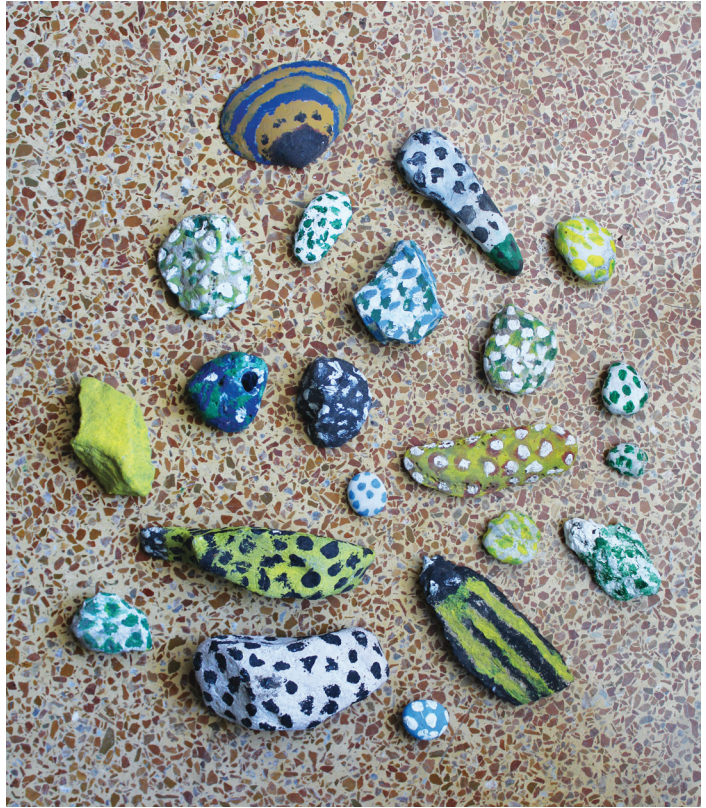
Ε.Παπαναστάση Λαδομπογιά σε πέτρες 10 εκ. μέγ. x 3 εκ. ελάχ.