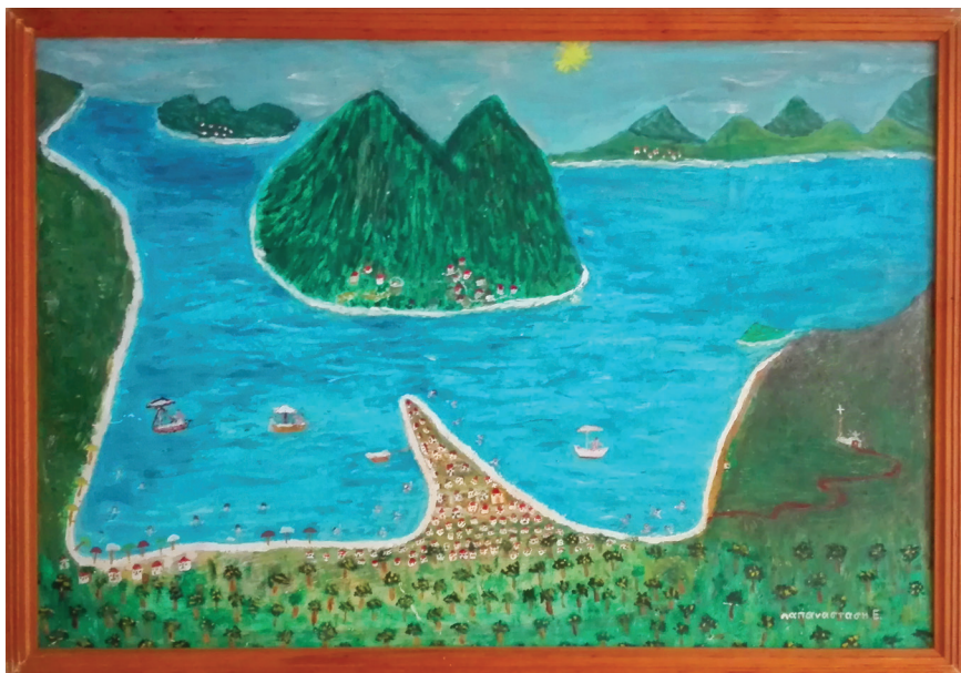
Ε. Παπαναστάση Ακρυλικά σε καμβά 1 μ. x 70 εκ.

Λόξευε δεξιά, σκαρφαλώνει πάνω στά αίματοβαμένα Ήπειρώτικα βουνά και τά χαϊδεύει. Και νά μπροστά της απλώνεται μιά στενόμακρη γαλάζια λωρίδα νερού πού φάνταζε σάν λίμνη τριγυρισμένη από βουνά: είναι ο Αμβρακικός κόλπος. Τό βλέμμα μου δέν σταματάει για πολύ, τρέχει, όλο τρέχει και πάλι δεξιά. Ξεχωρίζει τά μακρινά κι άγρια βουνά των Τζουμέρκων, τό Γκριζοπράσινο Μακρυνόρος, τόν Πεταλά και τ'άλλα Άγραφιώτικα. Τίς Ξηρομερίτικες λίμνες Άμβρακία και Όζυρό, τόν πεισματάρη Άσπροπόταμο, τήν άπέραντη Αίτωλοακαρνανική πεδιάδα, τήν πολιτεία του Άργινίου και τά γύρω σκορπισμένα γραφικά χωριά. Πιο κάτω τίς άδερφωμένες δυό λίμνες Άγγελόκαστρου και Άργινίου, πού φάνταζαν σάν δυό μεγάλοι καθρέφτες ξαπλωμένοι στη γή. Τό σκυθρωπό