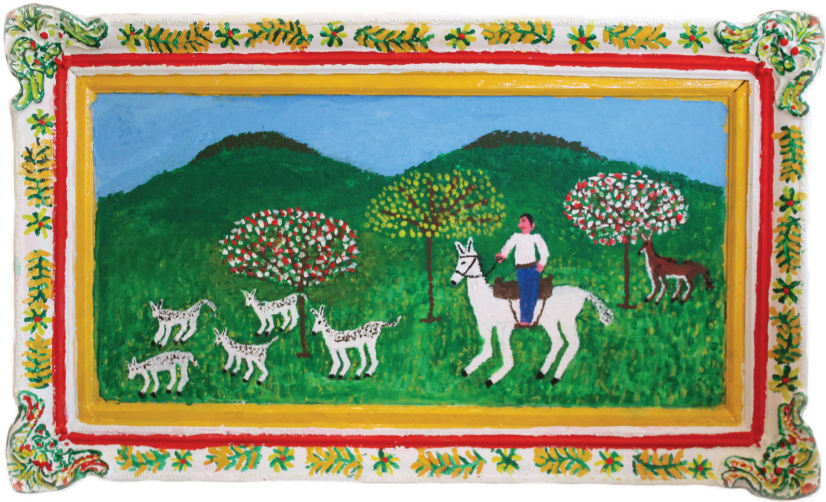
Ε. Παπαναστάση Λαδομπογιά σε ξύλο 50 εκ. x 1 μ.

Ἡ θέση πού διαλέξανε δέν τοὺς προστάτευσε μόνο ἀπ'τοὺς πειρατές, ἀλλά καί κατόπιν ἀπ' τοὺς Τούρκους, μετὰ τὴν κατάληψη καὶ τούτης τῆς περιφέρειας ἀπ' αὐτοὺς καί πρό πάντων τὸ μεγάλο δάσος πού περιέβαλε τότε τὸ χωριό ὅπως παρακάτω θά αναφέρω.