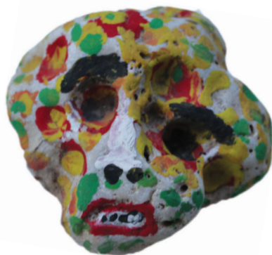
Ε.Παπαναστάση Λαδομπογιά σε πέτρα 15 εκ. x 15 εκ.

Πόσων χρόνων ήμουνα τότε πού μου συνέβηκε τό παρακάτω, ακριβώς δέν θυμάμαι. Δέν πρέπει όμως νά ήμουνα μεγάλος, γύρω στά δέκα μου. Μαθητής ακόμα στό δημοτικό, ίσως στην τετάρτη.