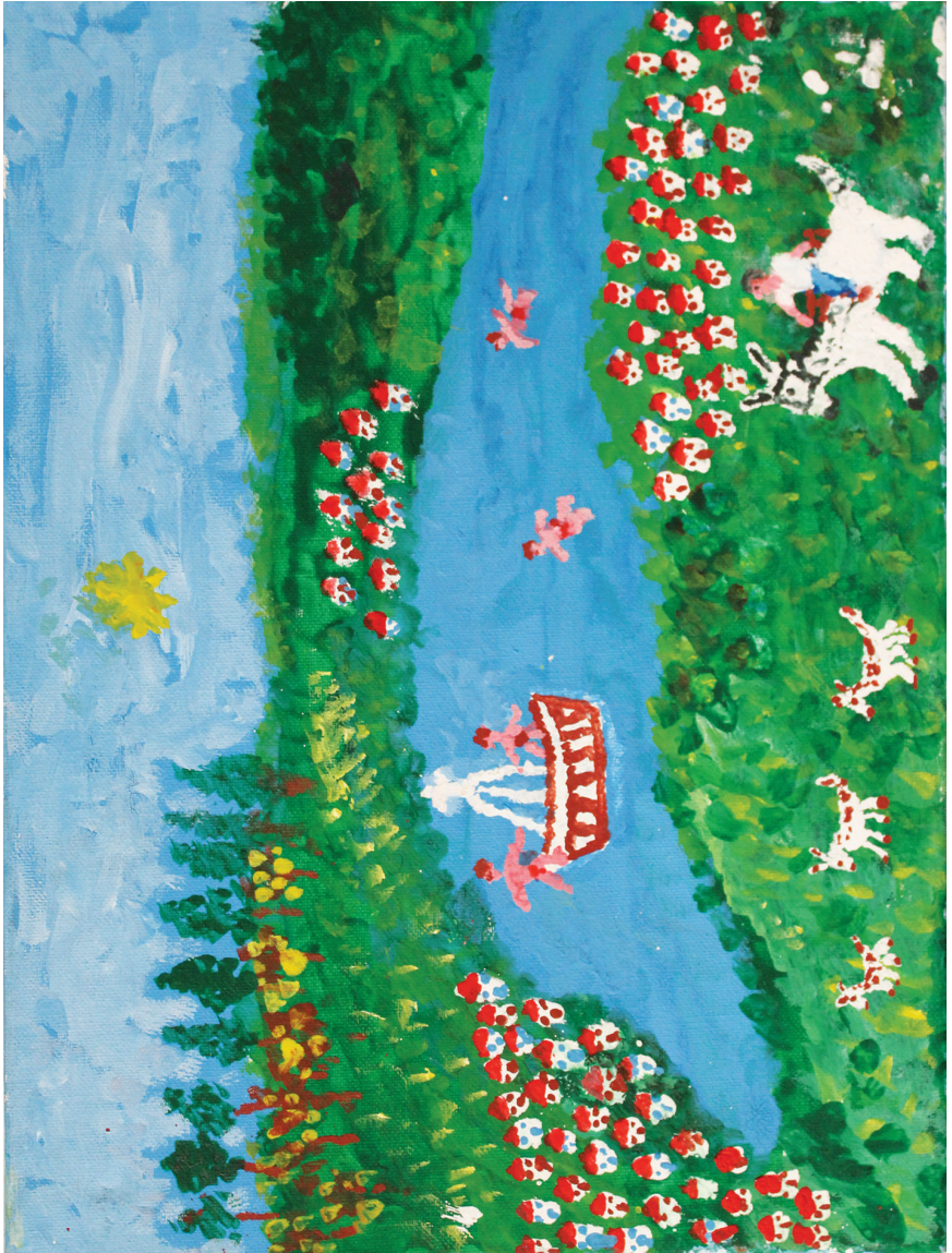
Ε. Παπαναστάση Ακρυλικά σε καμβά 40 εκ. x 30 εκ.