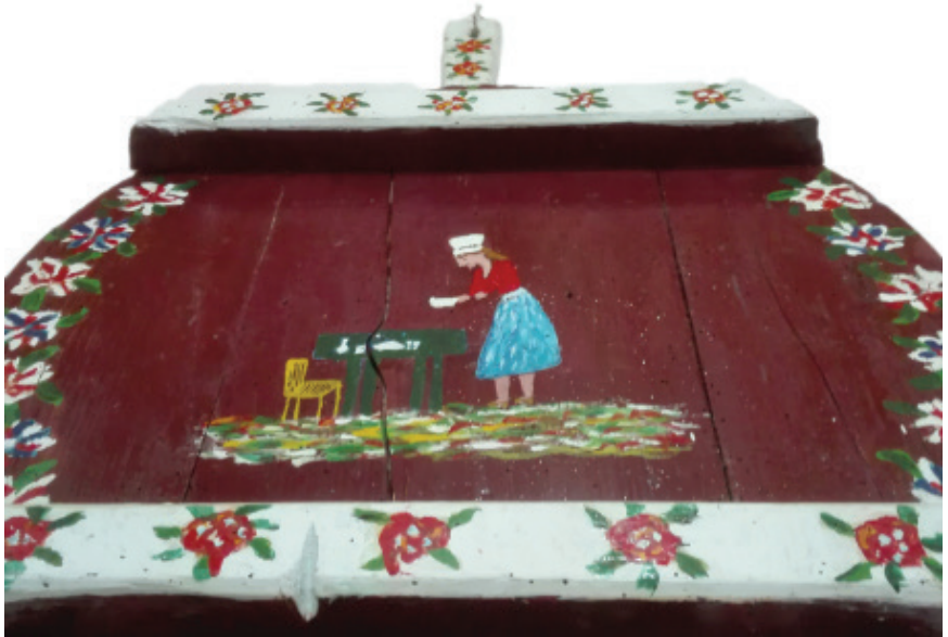
Ε.Παπαναστάση Λαδομπογιά σε ξύλο Χειροποίητο αντικείμενο για την παρασκευή ζύμης 80 εκ. x 80 εκ.

Τά μαλλιά καρέ μέ κότσο. Γιά νά φκιάξουνε τόν καρέ τοποθετούσανε πάνω ἀπ'το μέτωπο καί μέσα στά μαλλιά τους ἕνα μπομπάρι ἀπό ξένα μαλλιά, ἔτσι πού νά προεξῆχε τοῦ μετώπου κ'ῦστερα τὰ γυρίζανε πίσω καί φκιάχνανε τόν κότσο, τόν ὅποιο στεριώνανε μέ μιὰ εἰδική χτένα. Ἀπαραίτητη ἦτανε γιά τό καλοκαίρι ἡ χρωματιστή ὀμπρέλα, μέ μακριά χειρολαβή, τό δέ χειμῶνα μαύρη μέ κοντή χειρολαβή.