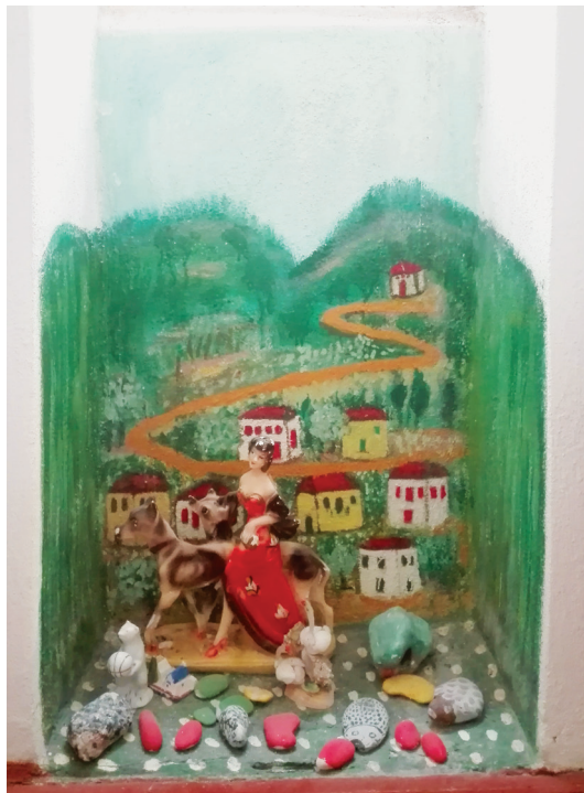
Ε.Παπαναστάση Εγκατάσταση σε εσοχή του εσωτερικού της οικίας 80 εκ. x 50 εκ.

Χρόνια καί χρόνια πέρασαν από τότε, μά θέλω νά μέ πιστέψετε πώς όσα είδα τότε μένουν ζωντανά στή μνήμη μου καί μιά μου έπιθυμία προβάλλει, νά μπορούσα μιά φορά ακόμα νά ξαγναντήσω σ’αυτές τίς ψηλές καί άλησμόνητες βουνοκορφές.