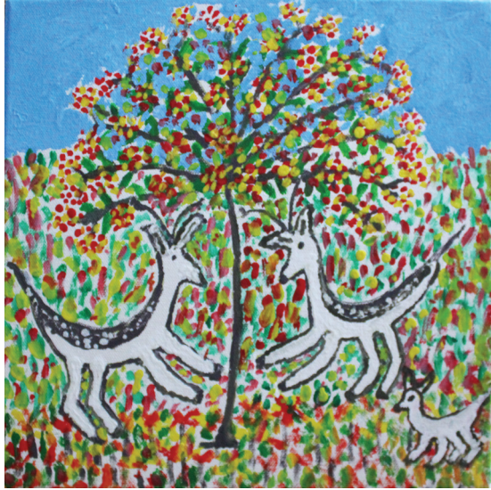
Ε. Παπαναστάση Ακρυλικά σε καμβά 15 εκ. x 15 εκ.