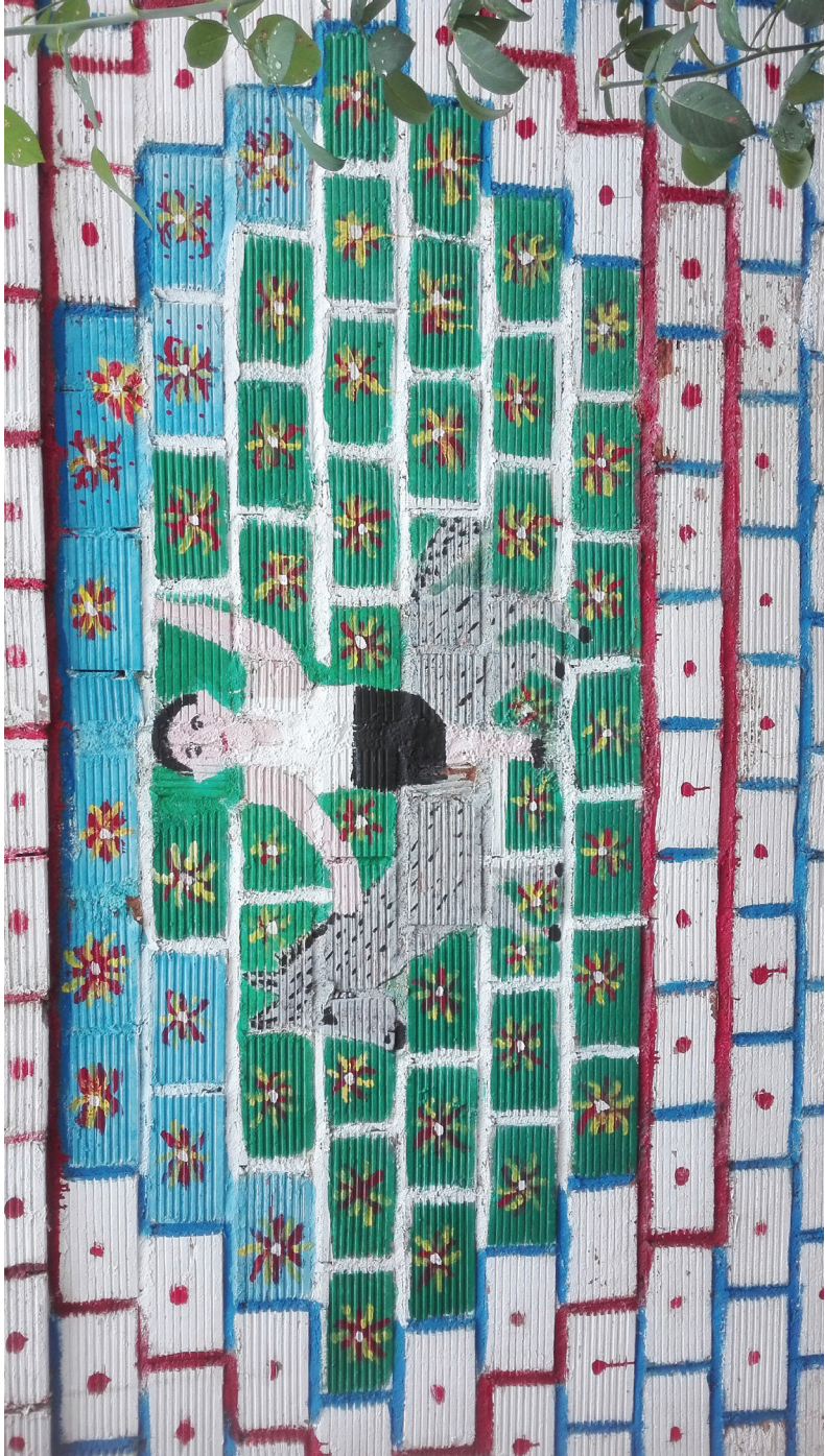
Ε. Παπavasίλση Λαδοπομπιά σε κεραμικά τούβλα, 3,5 μ. x 2 μ.