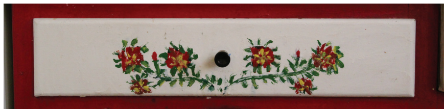
Ε.Παπαναστάση Λεπτομέρεια, Λαδομπογιά σε ξύλο, Συρτάρι στο εσωτερικό της οικίας, 50 εκ. x 15 εκ.