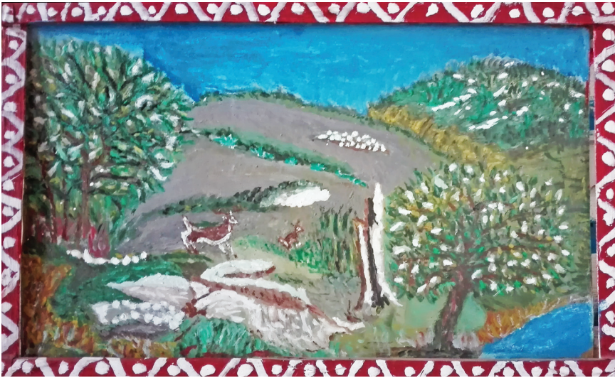
Ε. Παπαναστάση Ακρυλικά σε καμβά 15 εκ. x 15 εκ.

δέν πρόκειται νά γίνει αισθητός στήν κτηνοτροφία, δεδομένου ὅτι ἡ κτηνοτροφία ἀπ' τήν ἔλλειψη βοσκῆς ἔχει μειωθεῖ πολύ. Ἄλωστε ὁ τρόπος αὐτός θά εὐνοήσῃ τήν κτηνοτροφία, γιατί μέ τήν πάροδο τοῦ χρόνου θ' ἀφεθεῖ ἐλεύθερη ἡ βοσκή μέ πραγματική τροφή γιά τά ζῶα. Ἡ ἀνάπτυξη τῶν ἐλάχιστων θάμνων πού τώρα ψυχοραγούνε θ' ἀνατάξουνε καί θά δημιουργηθεῖ ἕνα ἐμπόδιο στά βρόχινα νερά, ὥστε νά διευκολύνεται ἡ ἀπορρόφησή τους ἀπ' τή γῆ. Ἡ τεχνική ἀναδάσωση ἐπιβάλλεται νά γίνει μέσα στό χωριό σέ δρόμους καί σ' ἐλεύθερους κοινοτικούς καί ἐκκλησιαστικούς τόπους, γιατί κι αὐτή ἀπ' τήν πλευρά της παράλληλα μέ τή φυσική ἀναδάσωση θά συμβάλῃ στήν υἱεία τοῦ πληθυσμοῦ καί στόν καλλωπισμό τοῦ τοπίου.