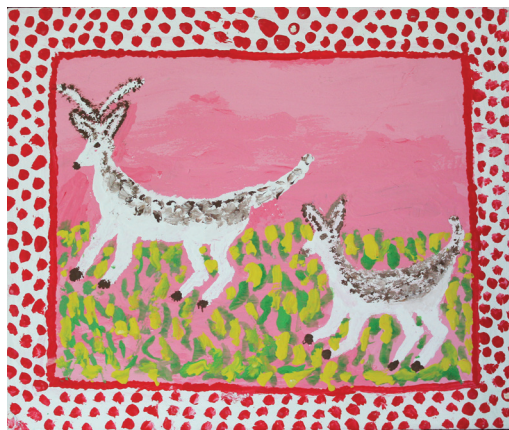
Ε. Παπαναστάση Ακρυλικά σε καμβά 30 εκ. x 20 εκ.

Τίς καλοκαιριάτικες διακοπές τῶν σκολιῶν τίς περνούσα στό χωριό μου. Ἄν καμιά φορά ἐπιχειροῦσα καμιά μικροεκδρομή, γύριζα πάλε πίσω γρήγορα, νά βρεθῶ κοντά του, νά τό χορτάσω, γιατί εἴξερα πῶς δέν θά περνούσανε καί πολλά χρόνια πού θά υποχρεωνόμουνα νά τό ἀφήσω ἴσως καί γιά πάντα.