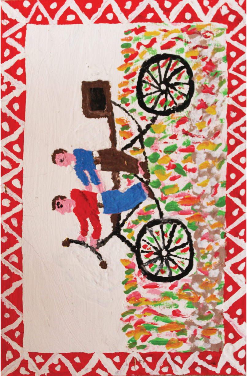
Ε. Παπαναστάση Ακρυλικά σε ξύλο, 40 εκ. x 30 εκ.